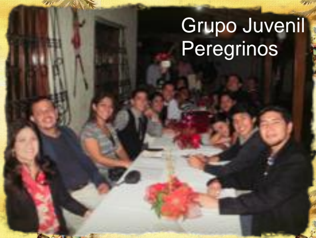
Grupo Juvenil Peregrinos