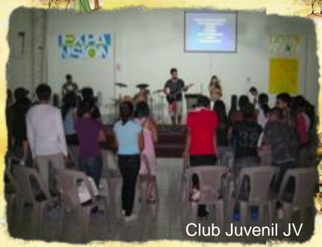
Club Juvenil JV