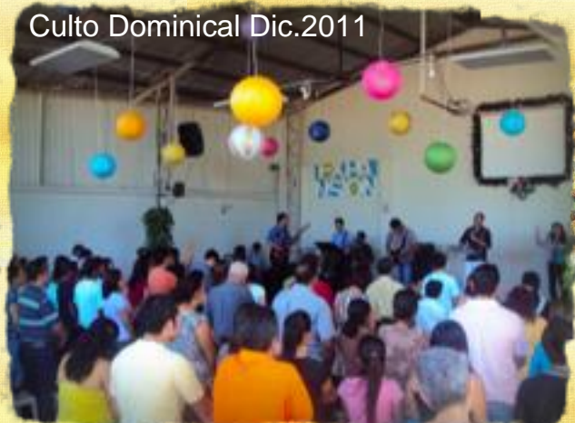
Culto Dominical Dic.2011