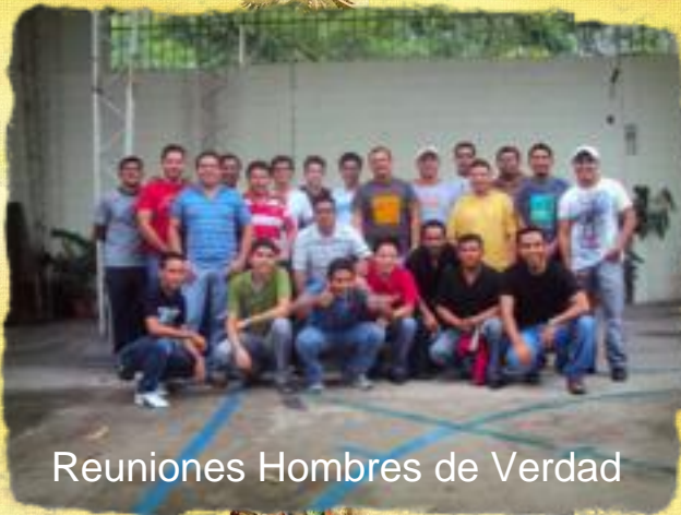
Reuniones Hombres de Verdad