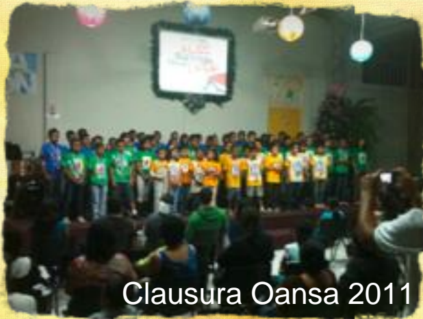
Clausura Oansa 2011

Agradecemos a los colaboradores locales que han sido parte activa y vital para la realización de los ministerios aquí destacados.