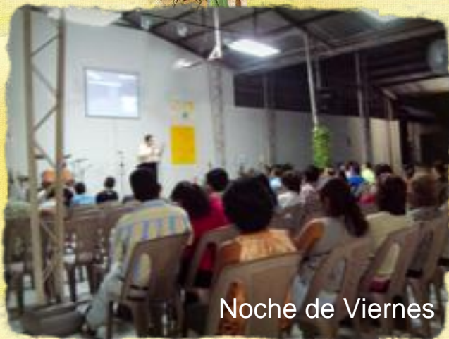
Noche de Viernes